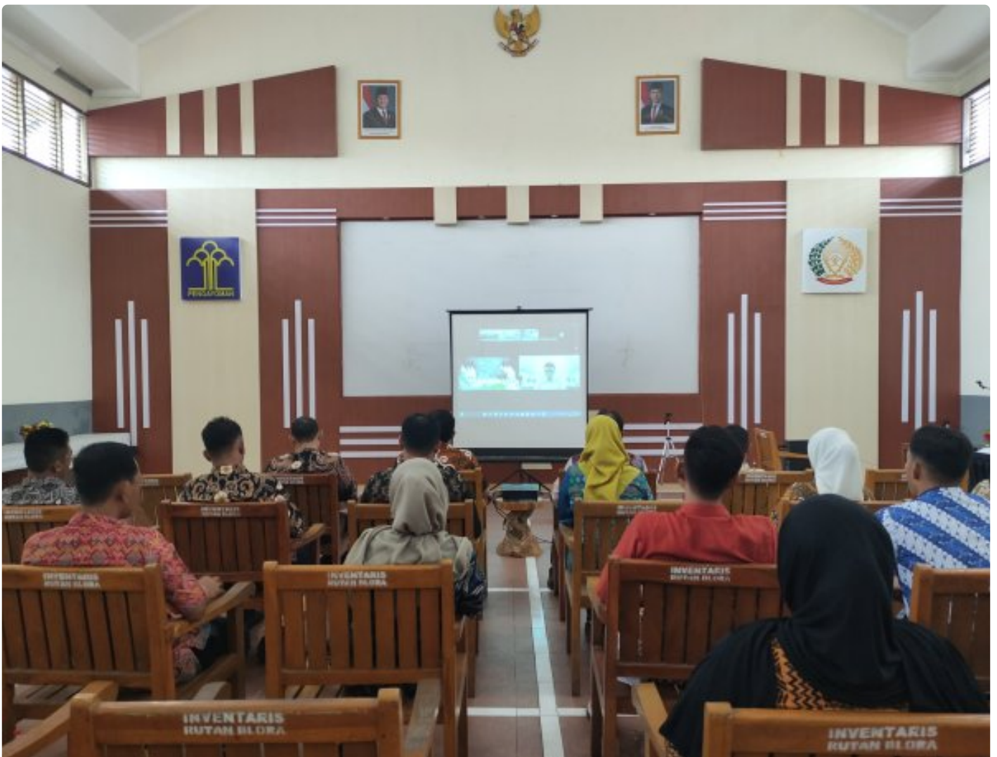
ASN Rutan blora ikuti pengarahen menteri kemenimipas

Blora - Rumah Tahanan Negara (Rutan) Kelas IIB Blora melaksanakan kegiatan pengarahan yang disampaikan langsung oleh Menteri Imigrasi dan Pemasyarakatan, Agus Andrianto. Kegiatan ini diikuti oleh seluruh ASN di